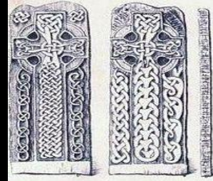
Pietra runica Kirk Michael II