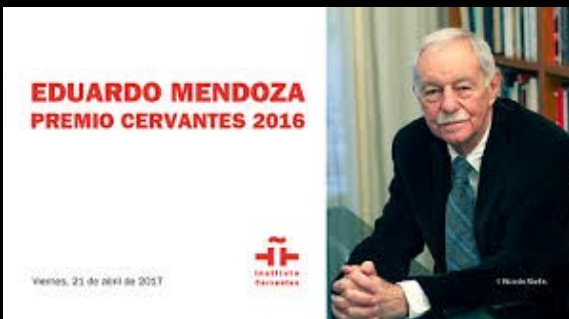
Eduardo Mendoza, Premio Cervantes 2016.

Técnicas ficcionales y significación político-social de los espacios narrativos en La verdad sobre el caso Savolta de Eduardo Mendoza.